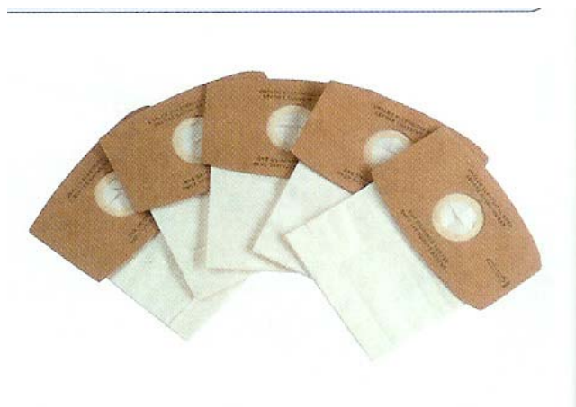
Obj.č. 5953 021 Sada náhradních sáčků,5ks Cena: 480,-